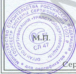
Схема сертификации З.